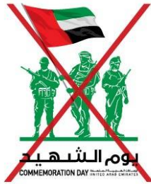
Never change the colours