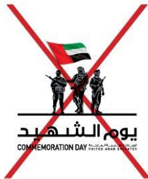
Never change the scale of the elements