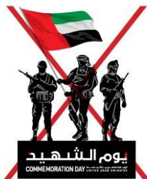
Never add other elements