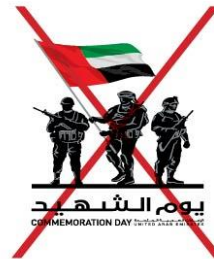
Never distort the proportions