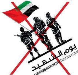
Never rotate the logo