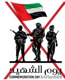
Never recreate using another typeface